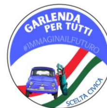
Luigi TEZEL: CONSIGLIERE – Capo Gruppo